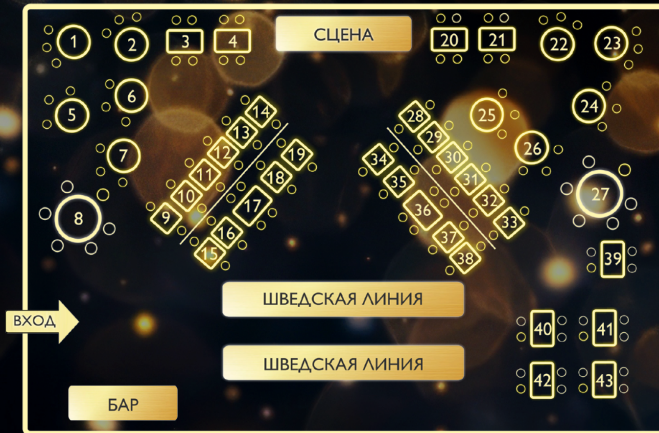
Схема зала изображена схематично и может отличаться от фактической. Отель оставляет за собой право изменить стоимость предложения и скорректировать схему.

В стоимость включен алкоголь безлимитно: игристое, вино красное/белое, водка, бренди, кофе, чай, безалкогольные напитки